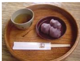
赤福、美味しかった!

伊勢神宮の隣のおかげ横丁では赤福のぜんざいや松坂牛の串焼きなど食べ歩きを楽しみました。皆さんも、心もお腹も(笑)満たされるお伊勢参りに行かれてはいかがでしょうか(^-^)/