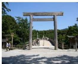
雰囲気のある鳥居です