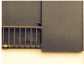
来年は新しい場所探してね

あまり開け閉めされていない戸袋に巣を作るとは常識のようで、安全とされると毎年同じ場所に巣を作ります。そこまでならツバメ感覚