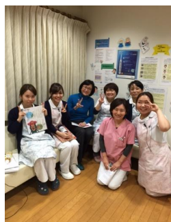
外部講師の歯科衛生士の先生と最新の「予防」について勉強しています!

さて、ひらの歯科では昨年より外部講師の先生をお迎えするなど院内で勉強会を開き「予防歯科」に取り組んでいます。文字通り、疾病を予防することを目的としています。