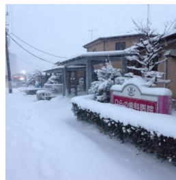
昨年の大雪の様子です!

こんにちは、歯科医師の遠藤です。 2月に入り立春を迎えましたがまだまだ寒い日が続いていますね。 雪の予報つく日もありましたね! 先日の積雪予報の際、昨年の大雪の経験をもとに頑丈なスコップを買いました。昨年の雪は本当に大変でした。私も9時からの診療に間に合うよう、夜明け前に家を出た記憶があります。 結果、スコップは使わずに済みましたが、備えあれば憂いなし、です!