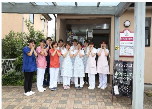
小顔に見えるそうです！

さて、先日 HP リニューアルに向けてプロカメラマンによる院内の撮影がありました。その場にいた方もいるかもしれませんがね。一通り撮影が終わり、最後に玄関前で集合写真を撮りました。巷で流行っているという「むし歯ポーズ」です。