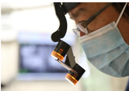
真剣なまなざしです！

新しい HP のアップはまだ先になりますが、カメラマンさんが一足先に診療中の私の写真を送ってくれました。やはりプロが撮ると違いますね！実物より5割増しくらいな感じで写っている自分にビックリしてしまいました。