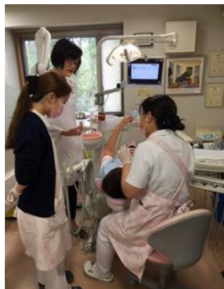
しっかり教わってね

以前は休診日などに各々セミナーなどに参加していましたが、それに加え昨年より外部の講師に定期的に医院に来て頂き、院内で研修を受けるようにしています。