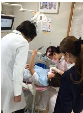
お互いに患者さん役

予防を何より大切にしている当院に通ってくださる皆さんに、より良い予防メンテナンスを受けていただけるように彼女たちは日々頑張っています！ 皆さんも当院のDHと一緒に健康なお口を手に入れてください！