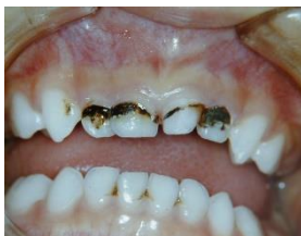
薬を塗って黒くなっています